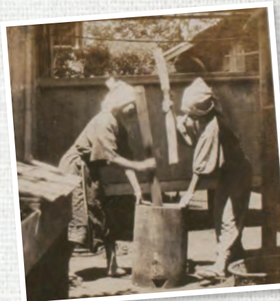
神奈川大学日本常民文化研究所蔵 アチック写真 上 [目録番号]ア-9-89 左下[目録番号]ア-105-2-2