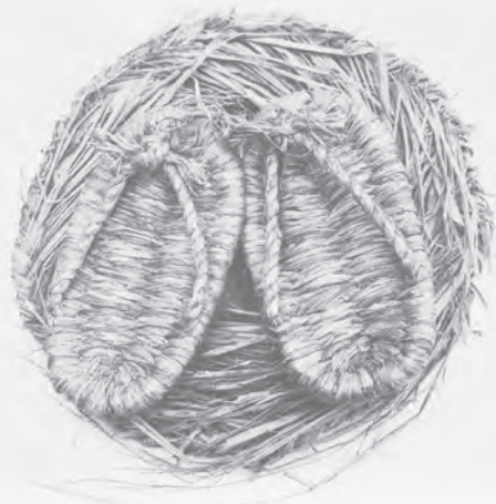
[目録番号] 河 1-16-10

人類は、道具を手にし、かつ言葉を獲得しそれを駆使することで「文化」的に展開したが、その行動適応の中で作られ用いられてきた道具類は、極めて早い時期に基本的な構造は完成しており、その姿や働きが、今日まで引き継がれているものも多く認められる。実際、民具は多様であるが、基本的な民具には、時代や地域、国や民族を越えて、共通する性格を見出すこともできるのではないかと。生活文化の比較は言語による認識の形成の違いが反映し、複雑に交錯するので多くの困難が伴うが、“暮らし”の中で作られ、使われてきたモノ、民具の基本的な形態や機能を手がかりにする方法論を確立することで、生活文化の基本的なありかたの国際的な比較ができる。このフォーラムで、民具を通して“人”の個性と普遍性を探る国際常民文化研究の可能性の一例を提示したい。