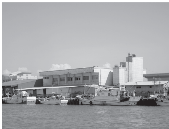
写真 5 台湾南部の東港（撮影：筆者、2011 年 3 月）