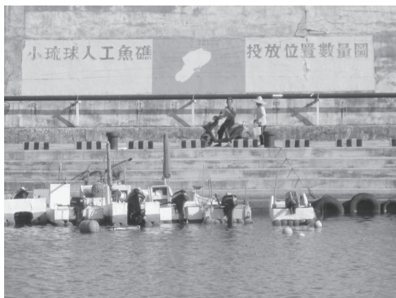
写真 4 台湾南部小琉球地区の大福漁港の防波堤に描かれたパヤオ位置図（撮影：筆者、2012 年 3 月）