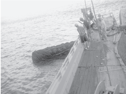
写真2 中層型パヤオの設置作業（撮影：行政院農業委員会水産試験所、2006年6月）

わせたものである。屏東県には、同年中、さらに5基の中層型パヤオを設置する計画があった。