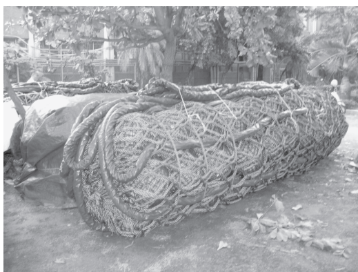
写真1 中層型パヤオ（2006年5月）

さらに、水産試験所によって、1983年から中層型パヤオの実験に着手し、その設計と製造に関する技術は1986年に確立した。これはウキを網袋に入れて円柱形のブイに多くの縄をつけたもの