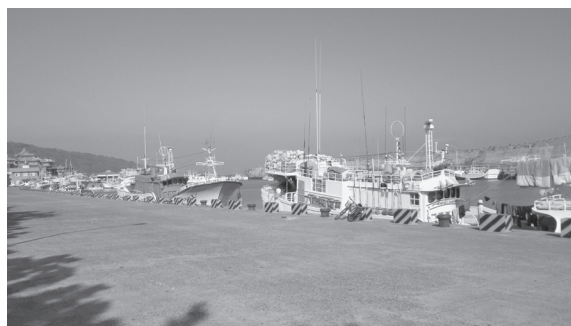
写真 3 台湾南部小琉球地区の大福漁港（撮影：筆者、2012 年 3 月）

台湾南部西岸海域には、「伝統型」パヤオも含めて約 100 基のパヤオがある。3 トンクラスの小型漁船は 1 泊 2 日の出漁を 1 週間に 2～3 回ほど行ない、周年で操業している。2 人での操業を原則とし、もう 1 人は大福漁港近くに住む知人である。一本釣り漁法や延縄漁法でキハダマグロやシイラ、カツオが漁獲されている。1 回の出