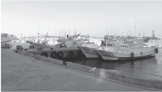
写真 6 台湾南部小琉球地区の白沙碼頭（2012年3月）

漁による平均的な漁獲量は 240～500 kg で、大福漁港のほかに東港へも水揚げすることが多い。マグロ類やカツオ類は刺身などの生食にすることもある（写真 3～5 参照）。