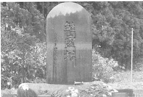
写真5 サケの供養碑—山形県飽海郡遊佐町の牛渡川右岸 昭和52（1977）年建立—

サケの供養碑や供養塔が東北各地にある。これは毎年、サケの豊漁への感謝の気持ちと、サケの生命を頂くことへの供養を表したものである（写真5） [赤羽 2006]。アイヌの場合、サケは「カムイ・チェップ」すなわちカミの魚と称され、カミの国から人間世界に使わされた幸と位置づけられている。チェップは「魚」の意味である。