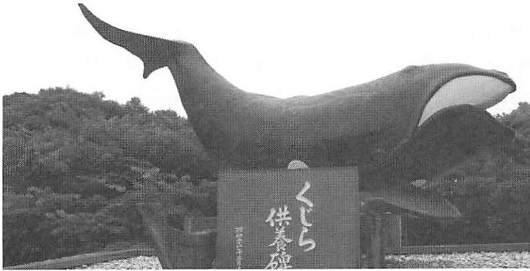
写真2 クジラ供養碑—和歌山県太地町・梶取崎 昭和54（1979）年建立—