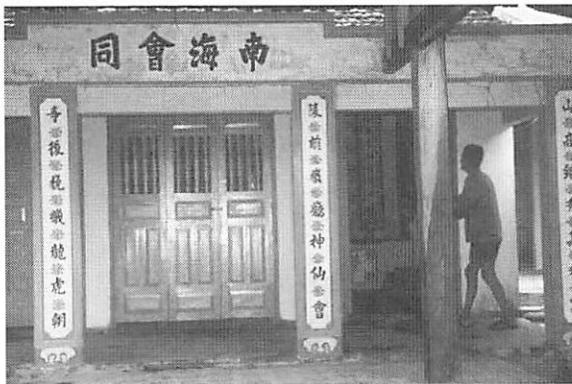
写真3 クジラ廟—ベトナム・ニャチャン—

鯨位牌：寺院などの仏壇に鯨霊などと書かれた位牌を安置して祈る。宮城県・鮎川の観音堂に安置されている位牌には「鯨霊魚霊畜霊各諸精霊」と記されている。（写真4）。