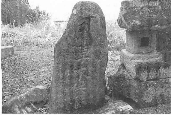
写真6 草木墓一山形県米沢市口田沢上屋敷、薬師堂内、寛政12（1800）年8月15日建立一