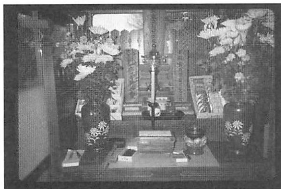
写真4 クジラの位牌—宮城県石巻市・鮎川の観音堂—

鯨位牌：寺院などの仏壇に鯨霊などと書かれた位牌を安置して祈る。宮城県・鮎川の観音堂に安置されている位牌には「鯨霊魚霊畜霊各諸精霊」と記されている。（写真4）。