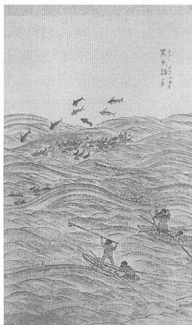
図2 イルカ漁（菅江真澄『えぞのてぶり』より 出典：『菅江真澄民俗図絵』岩崎美術社、1989）

世紀以降のアイヌはふつうの意味での捕鯨をしたといえるかどうかを確定することはできない状態である。弓矢の捕鯨の実態もよくわからない。しかし、アイヌに存在した捕鯨文化は、どのように捕獲したか、どのように利用したかということのほかにも考えることができると思う。