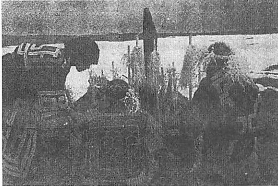
図4 昭和13年、再現された長万部のクジラ儀礼

も好ましいことであるという、狩猟という営みや獲物の霊に対するアイヌの基本的な考え方である。鯨をまつことはアイヌ語でノミ (nomi) という言葉が使われるが、決して熊やシャチの場合のようにイオマンテと言うことはない (名取)。