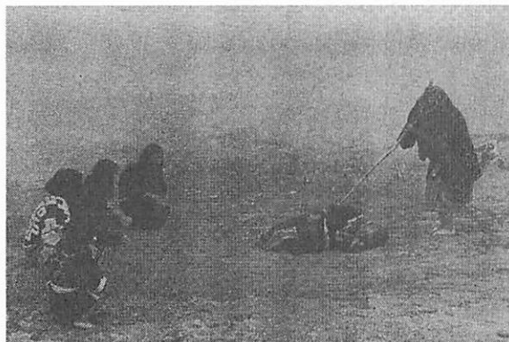
図5 白老のクジラ踊り

鯨にまつわる芸能として、ウポポと呼ばれる歌やリムセという歌舞が太平洋岸に伝えられているが、寄り鯨や、シャチが鯨を追うさまや、鯨を隠喩に使った内容である (日本放送出版協会1965)。