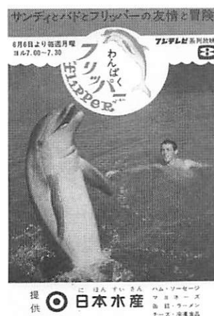
図3 マイアミ水族館で撮影された「わんぱくフリッパー」の宣伝広告