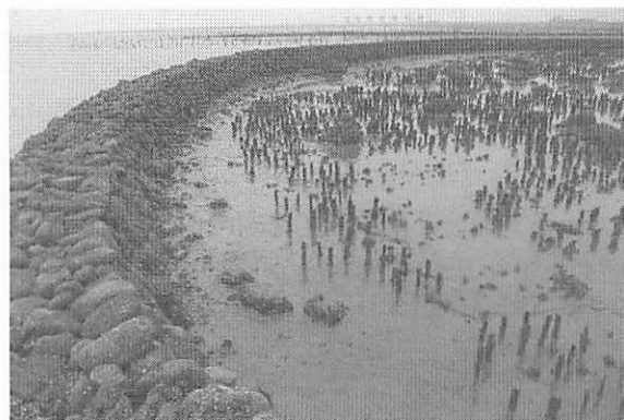
写真2 長崎県諫早市北高来町水ノ浦に残るスキイ（2010年）

沖縄県石垣市白保では、2005年9月に「白保魚湧く海保全協議会」が発足した。これはサンゴ礁を保全するとともに、持続的に利用し、地域振興につなげることを目指して、地元の有志によって設立されたものである。同協議会は、発足と同時に「海とともにある持続的なシンボルづくりとして、自然とともに生きて来た文化遺産である「海垣（インカチ）」を復元し、体験型・文化施設として活用する」ことを決定した（上村，2007）。2006年にはインカチ1基が復元された（写真6）。かつて地元ではインカチから多くの食料を得ていた。地域に住まう人々がそのことを記憶し、生活にかかわっていたインカチを白保の文化として次世代に残したいという強い気持ちの表れである。