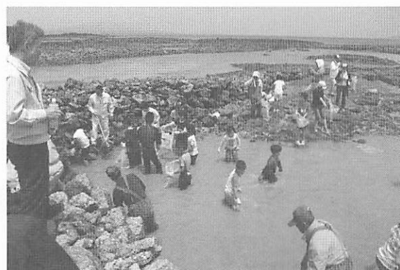
写真4 石干見内での体験漁業：長崎県五島市富江（2009年）