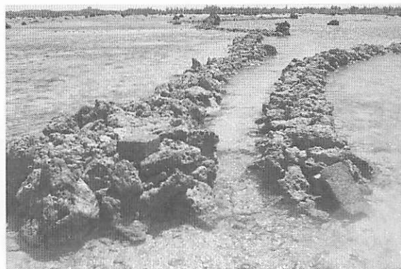
写真3 沖縄県宮古列島伊良部島佐和田のカツ（2005年）