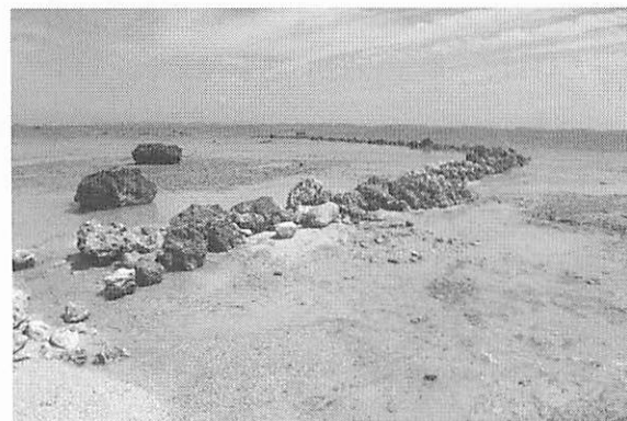
写真6 沖縄県石垣市白保に復元された竿原（ソーバリ）のインカチ（2010年）