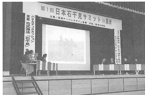
写真7 大分県宇佐市長洲で開催された第1回石干見サミット(2008年3月)