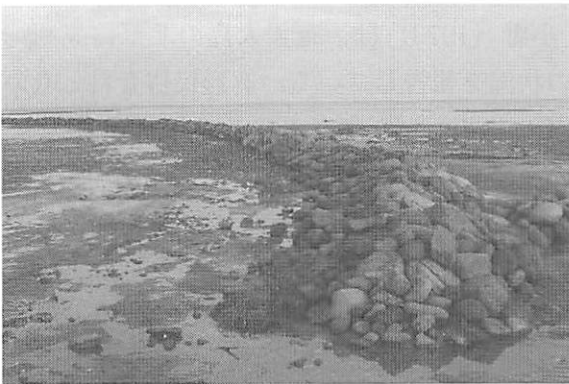
写真1 大分県宇佐市長洲に復元されたイシヒビ（2007年）

大分県宇佐市の長洲海岸にはかつて大小7基のイシヒビが存在した。イシヒビ漁は1955年頃までおこなわれたという。その後、イシヒビは荒れるにまかされ、石積みの跡がわずかに残るにすぎなかった。そこへ2006年10月、「長洲の町のこれから」を創造する目的で結成された「長洲アーバンデザイン会議」が中心となり、イシヒビが復元された（写真1）。これを環境教育や魚とりを楽しむ体験型観光に活用しようとしたのである。この団体とともに、宇佐市役所商工観光課が外部との調整役を担っている。石干見が地域貢献やツーリズムのための装置として、いま脚光を浴び始めているといえよう。