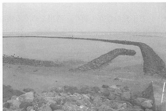
写真5 長崎県島原市に復元されたスキイ（2010年）