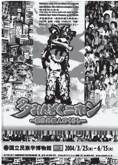
写真1 民博特別展「多みんぞくニホン」のポスター

担当することになっていた社会科地理的分野のカリキュラムに同展示を活用した新しい単元構成を試みた。その背景には、多文化化の進展する中で、「足下の日本社会を誰にとっても住みやすい公正な社会にするために、日本に住む多様な人々についても、もっと理解を深め、彼らの直面する問題や、それらが私たちの生活とつながっていることを知る必要性が、急速に増してきている 5) 」という認識があった。