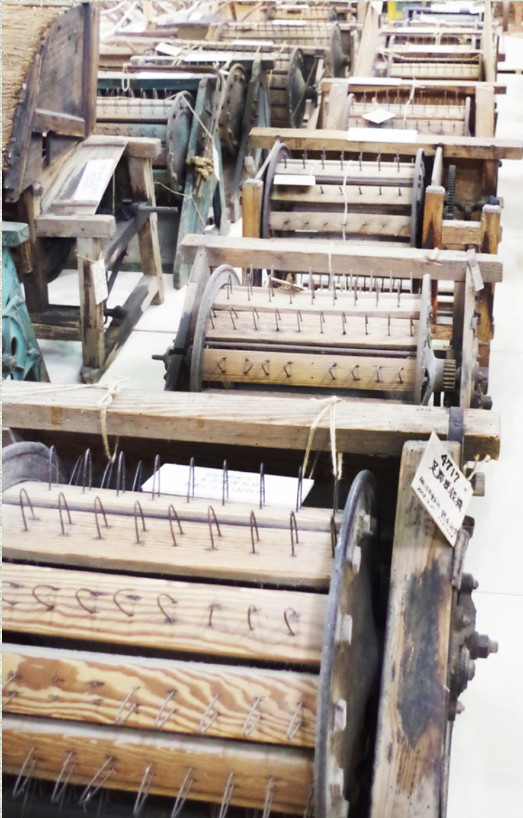
砺波民具展示室（富山県）